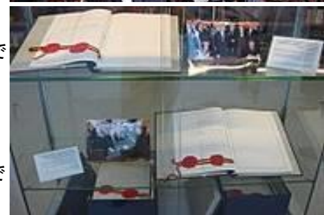
東西ドイツ 統一契約書