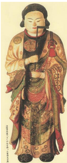
差金を持つ太子像

私も「 工務店経営 」に携わっていながら、こんな日があったとは恥ずかしながら全く気付きませんでした… 11月22日 は「 大工さんの日 」だったんですね。今から24年前の1999年4月に「 第一生命保険相互会社 」が全国の幼児・児童を対象に「 大人になったらなりたい職業 」のアンケート調査を実施しました。その結果、男の子の 第1位 に選ばれたのがなんと「 大工さん 」でした…この結果を知って「 一般社団法人 日本建築大工技能士会 」は子供達の将来の夢と希望に応える事は、とりもなおさず建築大工業界の発展に繋がるもの…として、毎年11月22日を「 大工さんの日 」として翌年の2000年5月3日に、 日本記念日協会 に登録しました。